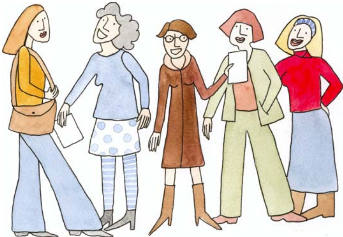
Bild 1 Kvinnor i nätverksbanksprojekt i Jämtland Illustratör: Annika Molander

Ett problem när det gäller kvinnor i vårt län är att de flyttar och skapar ett kvinnounderskott särskilt i vissa åldersgrupper. Det finns församlingar i länets ytterområden där det i åldern mellan 25 och 45 år går tre män på varje kvinna, (Näsman, 1995). Jämtland har dessutom en ganska låg andel innevånare som kommer från andra länder, (SCB). Sammantaget är utflyttning från länet ett av de största problemen med en omfattande befolkningsminskning de senaste åren, (ibid). Kan denna projektmetod bidra till att fler kvinnor väljer och/eller får möjlighet att stanna kvar i vår region?