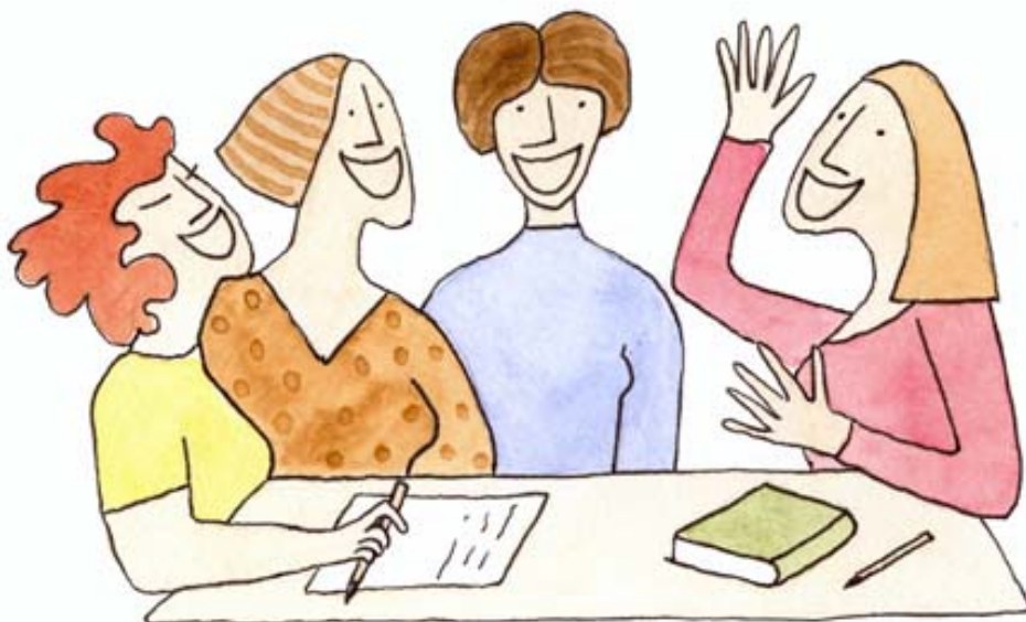
Bild 12, Nöjda nätverksdeltagare i projektet nätverkbanken i Jämtland Illustratör: Annika Molander

Min bedömning är att denna metod för att stimulera tillväxt och nyföretagande är kostnadseffektiv och kan användas för både kvinnor och män. Men den förutsätter en rutinerad projektledare som har möjlighet att ta stöd av olika specialkompetenser. Det är också viktigt att ha en huvudman för projektet som redan har en fungerande organisation med tillgång till moderna datorsystem och annan kontorsservice, som projektledaren kan ha som utgångspunkt för sitt arbete. I en region med långa avstånd och begränsade näringslivsnära aktiviteter ger metodanvändningen särskilt god effekt.