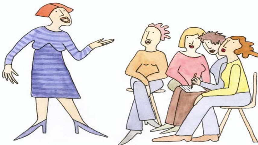
Bild 8, Utvecklingsinsats inom projektet Illustratör: Annika Molander

De små nätverken motsvarar ett behov hos företagarna, som förefaller extra stort i denna typ av region, behov som de haft svårt att lösa på egen hand. Nätverkandet kan ge ringar på vattnet när deltagarna inser värdet av att delta i ett skapat affärsnätverk. Studien visar att nätverken varit mycket värdefulla, liksom projektets utvecklingsinsatser med tanke på regionens långa avstånd och begränsade utbud av aktiviteter som vänder sig till företagare, och där lämpliga affärsnätverk normalt inte finns för kvinnorna.