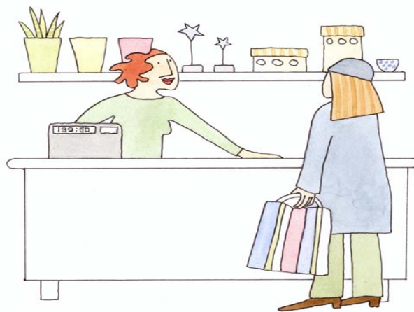
Bild 6, Ett handelsföretag finns inom projektet Illustratör: Annika: Molander

Noteras kan att många av deltagarna kan sägas tillhöra nya framtidsbranscher om jämförelser görs med Wahlström (2002), där han bland annat pekar på upplevelser och ”spa” som viktiga affärsområden. Tjänsteföretag inom hälsoområdet innehåller emellanåt spa-relaterad verksamhet som är väl representerade i projektet. Bland deltagarna finns ett par exempel på hur deltagarna försöker kombinera olika branscher för att skapa en heltidsförsörjning och även exempel på hur deltidsanställning kombinerats med företagande på deltid.