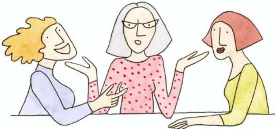
Bild 4, Tre av deltagarna i ett av nätverken Illustratör: Annika Molander

och mina barn stöttar mig till hundra procent”. Det bästa med detta projekt anser hon varit att hon träffat andra och fått diskutera olika möjligheter att gå vidare i livet. Svårigheterna för henne har varit att få tillstånd från Försäkringskassan att delta i projektet utan att mista sin sjukersättning. Vi tar lite fika tillsammans och sedan lämnar jag gruppen som ser ut att ha mycket att behandla trots att klockan passerat 21.00.