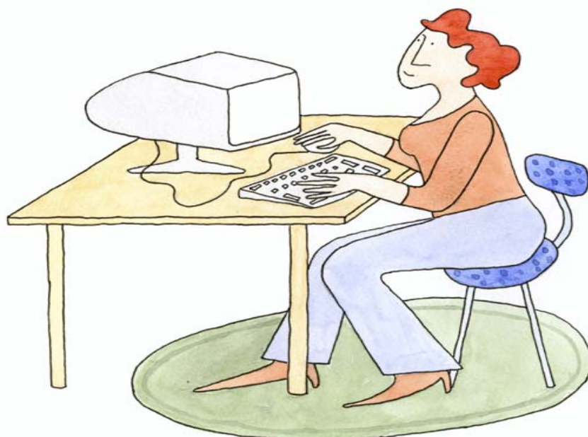
Bild 3, Företagarkvinna med kontorsarbete