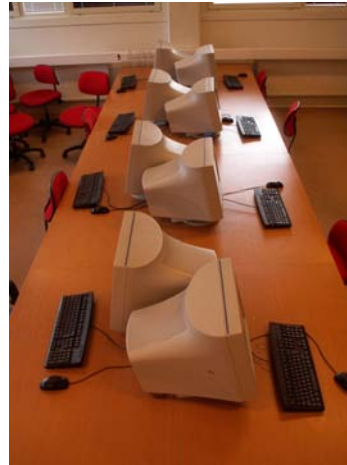
Figur 4. Borden placerade mot varandra så att man kan utnyttja båda bordskivorna och placera bildskärmarna omlott. Ett sätt att skapa längre synavstånd och bättre möjlighet att avlasta underarmarna på bordet.