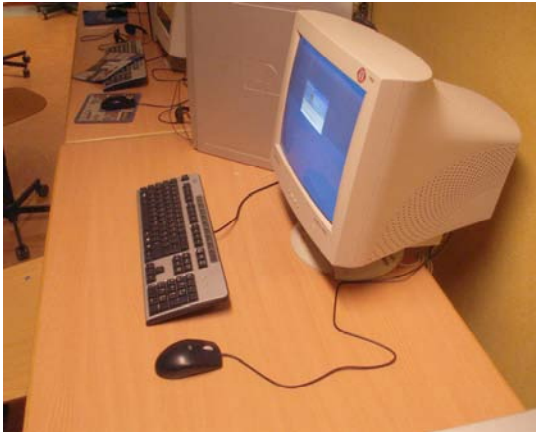
Figur 3. Bordet utdraget en bit från väggen så att bildskärmens bakre del kan skjutas ut över bordskanten. Ett sätt att skapa längre synavstånd och bättre möjlighet att avlasta underarmarna på bordet.

bildskärmarna omlott och därmed utnyttjat varandras bordsytor (figur 4). En annan lösning på problemet är att införskaffa platt skärm.