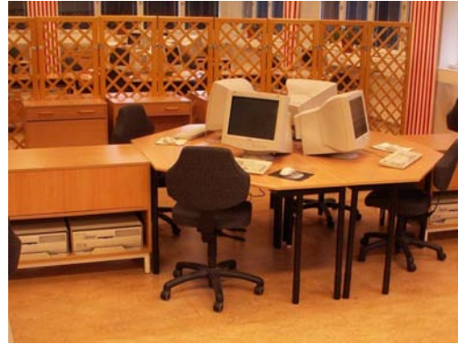
Figur 6. Datorenheterna är placerade i en hurts bredvid arbetsplatsen, för att slippa placering på eller under bordet.