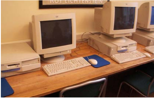
Figur 5. På den vänstra arbetsplatsen har datorenheten placerats bredvid bildskärmen i stället för under, som på den högra platsen.